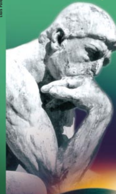
Lluís Parera Disseny Gràfic