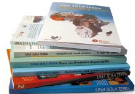
L'associació Una Sola Terra, en col·laboració amb la Diputació de Barcelona, edita en format llibre el recull de les ponències i dels col·loquis de cada simposi.