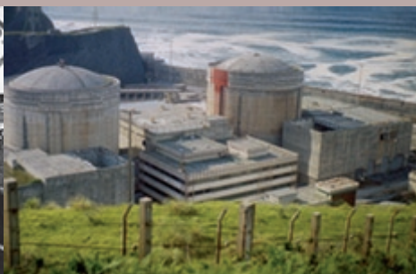
Estat actual de la central nuclear de Lemoiz a la Cala Basordas.