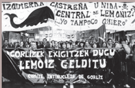
Manifestació antinuclear a Bilbao.